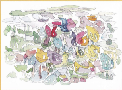
„Reispflücker“ Indien 4/2014