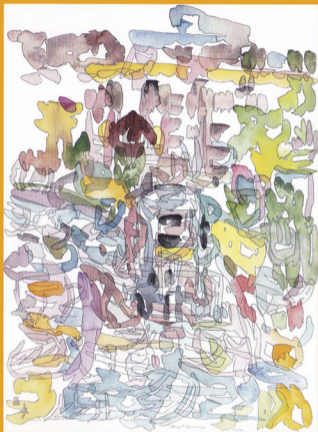
„Hampi“ Karnataka, Indien 3/2014