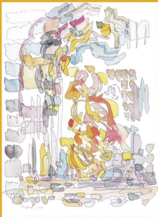
„Tempelruf“ Indien 5/2014